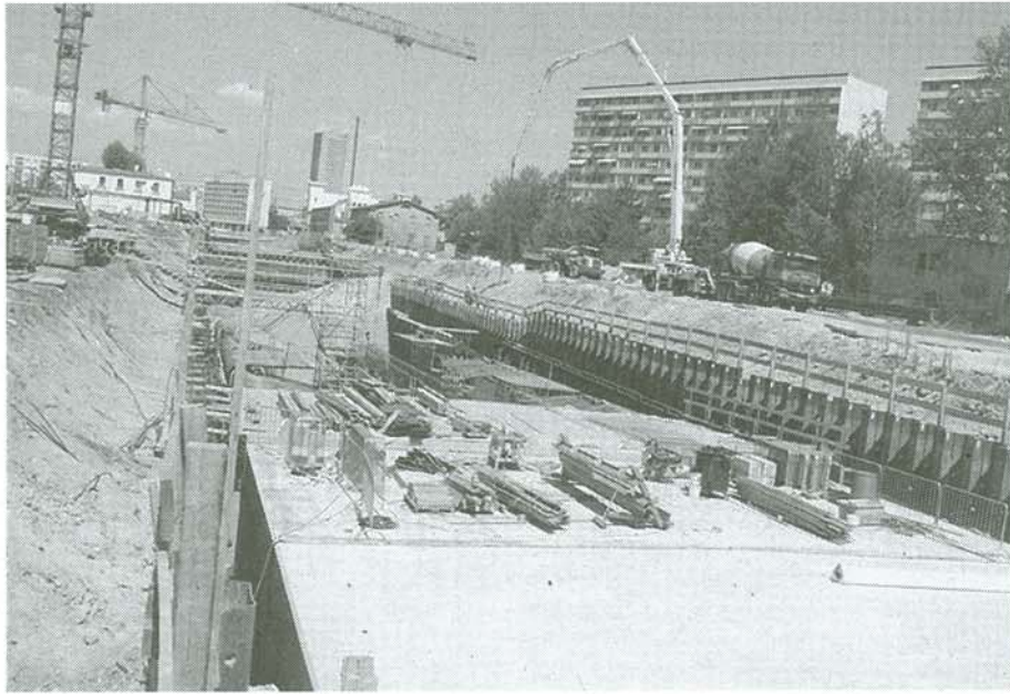
Ausbau der Tunneldecke in Leipzig.

Das Bauprojekt City-Tunnel wurde in drei Rohbaulose aufgeteilt. Das Los A umfasst den südlichen Abtauchbereich des Tunnels, bestehend aus einer Rampe im Einschnitt und einem Rechteckentunnel, der in offener Bauweise realisiert wird. Dieser verläuft bis zum Südkopf der Station Bayerischer Bahnhof. Daran schließt sich das Los B an. Dieses