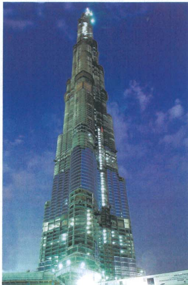
Burj Dubai: Schon vor der Fertigstellung das höchste Gebäude der Welt.

Ankerschienen sind in der Lage, Belastungen in alle Richtungen an jeder Schraube aufzunehmen. Bei gleichzeitiger Beanspruchung in mehrere Richtungen darf die Lastresultierende die zulässigen Lasten nicht überschreiten. Montage und Feinjustage der Aufzugsführungsschienen sind in Schienenlängsrichtung stufenlos möglich, so dass auch Bau-